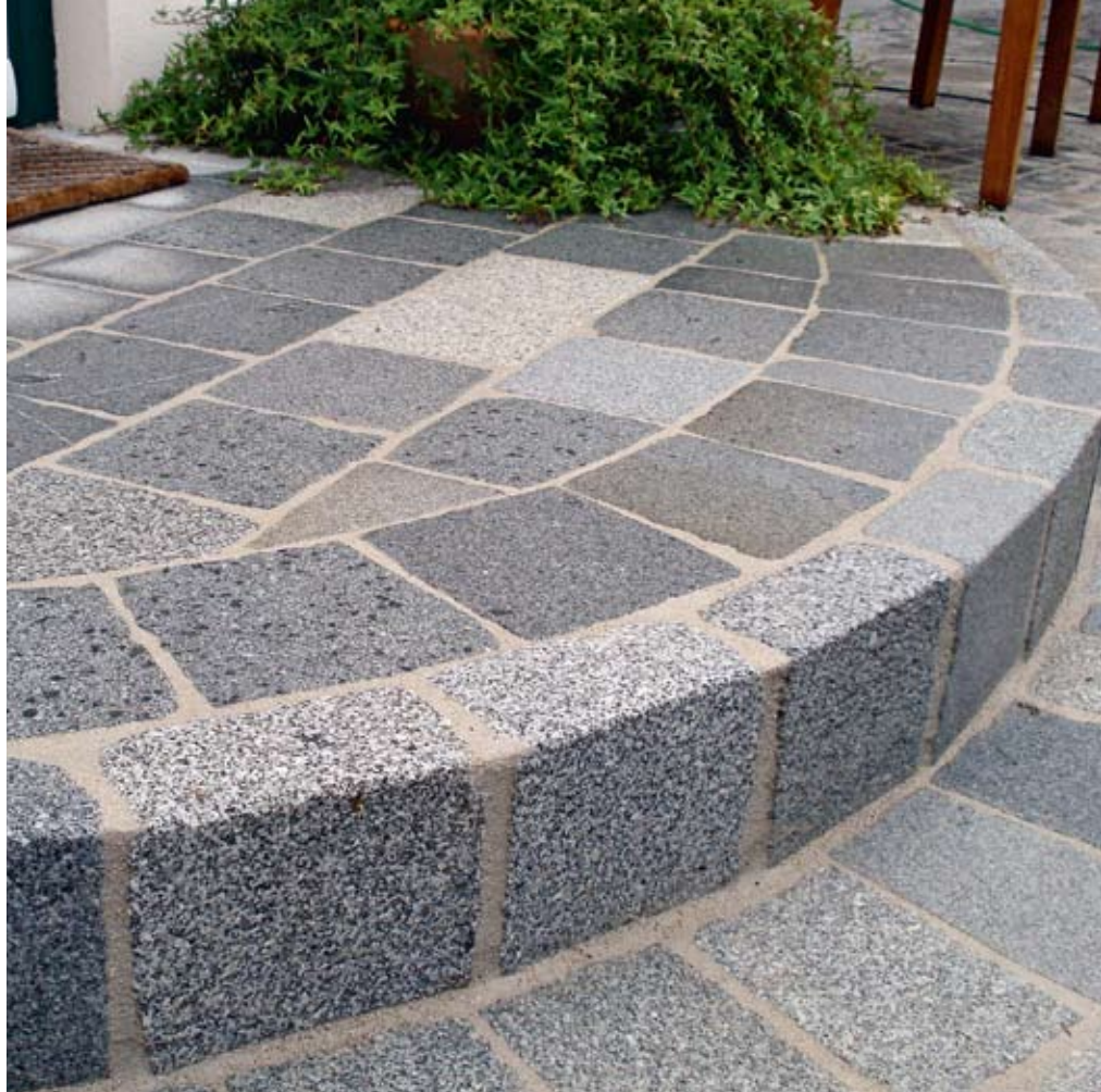
Altes Pflaster, gesägt und gestrahlt – auch heute wird der Wiener Würfel noch vielfach eingesetzt, gepflastert wird nach den alten Techniken

TEXT: Joachim Kräftner , Wien/A